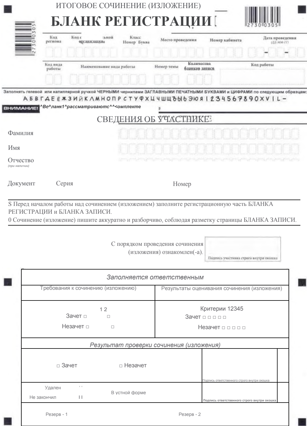
Рис. 1. Бланк регистрации