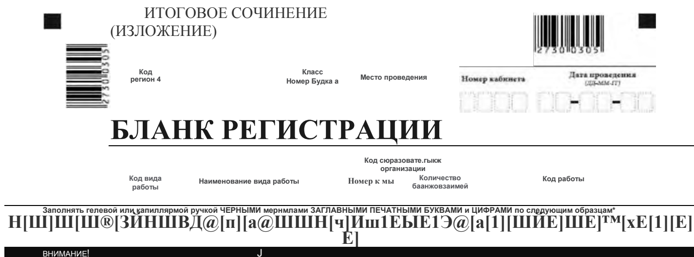
Рис. 2. Верхняя часть бланка регистрации

Бланк регистрации (рис. 1) состоит из трех частей: верхней, средней и нижней.