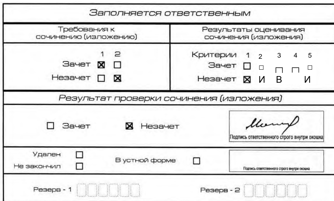
Рис. 9. Область для оценки работы

Если итоговое сочинение (изложение) соответствует требованию № 1 и требованию № 2, то выставляется «зачет» за выполнение требования № 1 и требования № 2. Указанные сочинения (изложения) далее оцениваются по критериям.